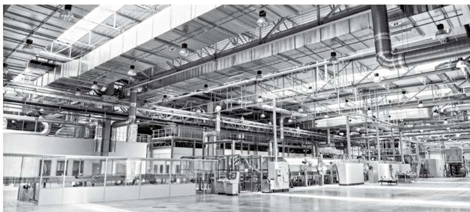
Linia APBL – zrobotyzowany załadunek szyb do pieca elektrycznego.

Najważniejszym elementem drugiej z linii (BOX) są dwa oparte na nowatorskich rozwiązaniach piece do produkcji szyb samochodów osobowych i ciężarowych. W procesie tym zakład jest w stanie wyprodukować szyby o max szerokości do 2,5 m. Uniwersalność tej linii dopełnia możliwość produkcji szyb ogrzewanych.