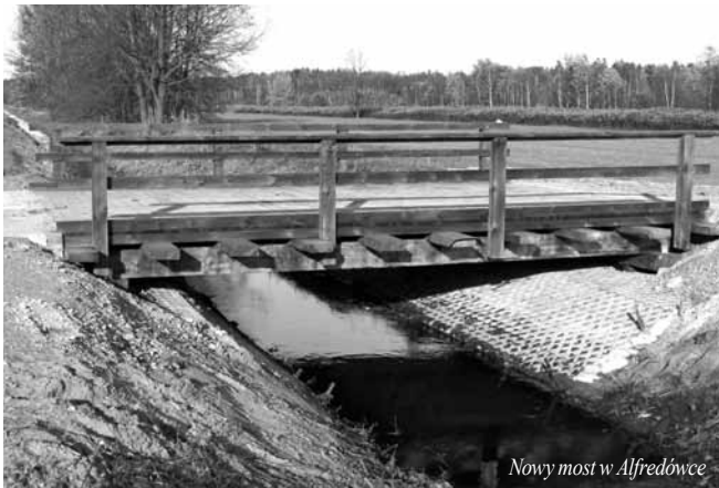
Nowy most w Alfredówce