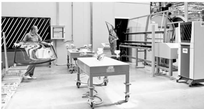
Linia BOX – linia końcowej kontroli jakości szyb samochodowych (załadunek).