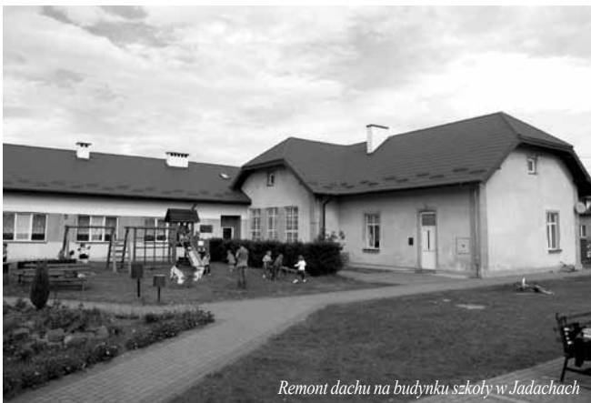
Remont dachu na budynku szkoły w Jadachach