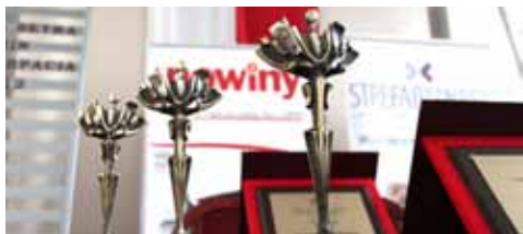
Aktywna Nowa Dęba...