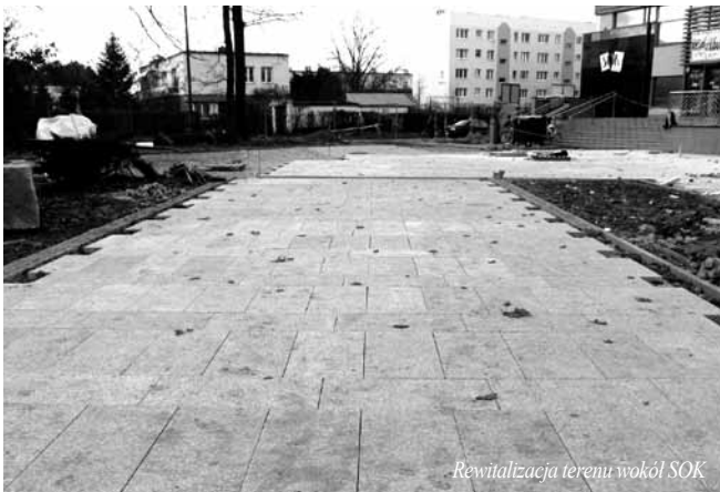
Rewitalizacja terenu wokół SOK