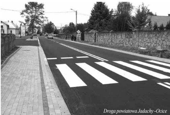
Droga powiatowa Jadachy - Ocice