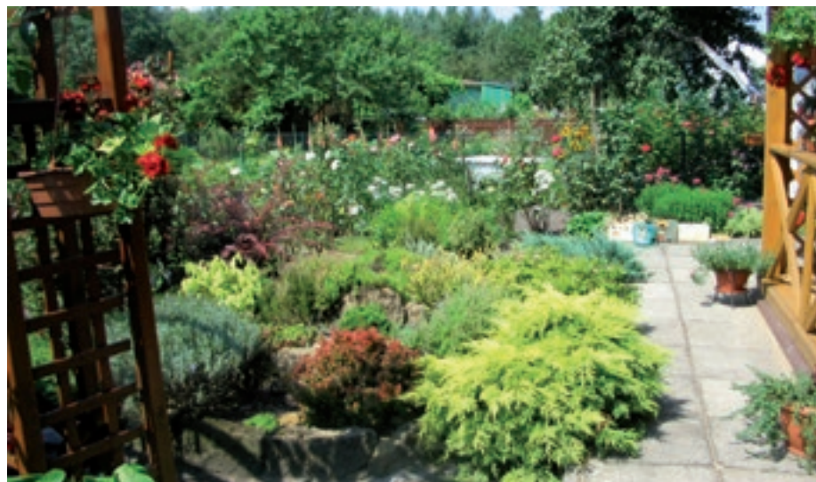
Konkurs Wzorowa działka - edycja 2014

akumulatory i baterie, przeterminowane leki. Od początku funkcjono-