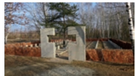
Cmentarz wojenny w Chmielowie

Zadanie było finansowane z budżetu państwa i z budżetu gminy.