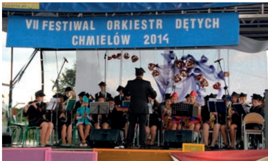
Festiwal orkiestr dętych w Chmielowie

Ubiegłe lata to również czas inwestycji realizowanych przez SOK, m.in. termomodernizacji Filii w Rozalinie, wykonanie elewacji budynku w Cyganach, adaptacji i remontu pozyskanych