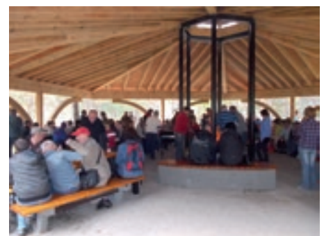
Spotkanie podopiecznych Środowiskowego Domu Samopomocy

wsparcie w przezwyciężaniu trudnych sytuacji życiowych, pomoc w zaspokajaniu niezbędnych potrzeb życiowych, postępowanie rehabilitacyjne rozumiane jako zespół działań zmierzających do osiągnię-