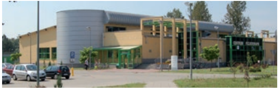
Pływalnia kryta - SOSiR

- Oddanie do użytku szatni klubu sportowego LZS Cygany - parterowy budynek z szatniami, wc prysznicami i poddaszem użytkowym na pomieszczenia klubowe.