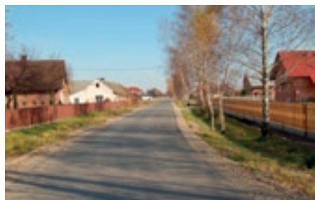
Ulica Cygańska w Cyganach