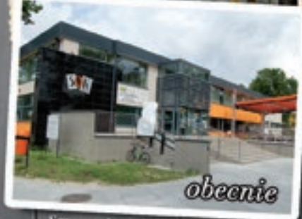
Samorządowy Ośrodek Kultury