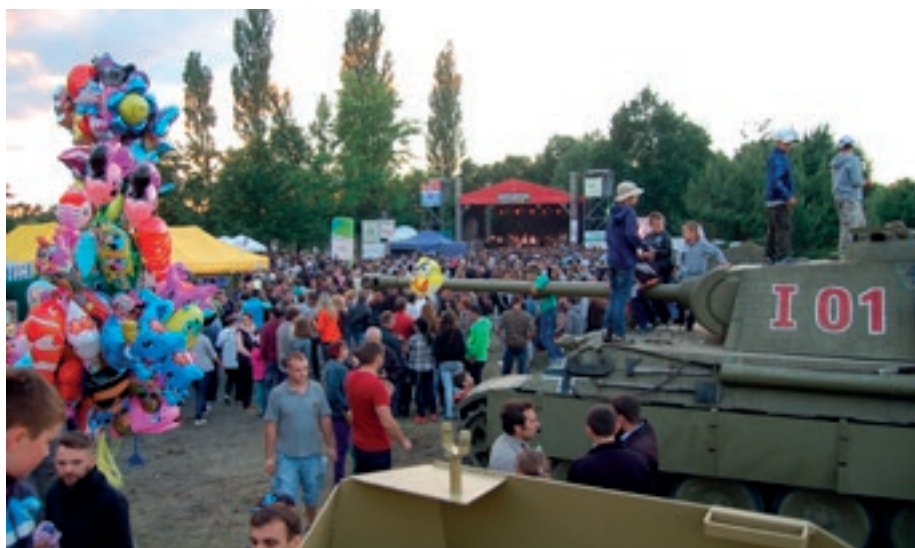
Święto Nowej Dęby - Militariada