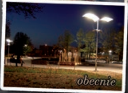
Plac mjr Jana Gryczmana