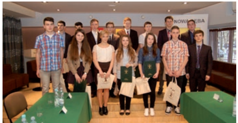
Młodzieżowa Rada Miejska

Do zadań Młodzieżowej Rady Miejskiej należy przede wszystkim zapewnienie uczestnictwa młodzieży w procesie podejmowania decyzji, które bezpośrednio ich dotyczą, a także reprezentowanie interesów młodzieży wobec instytucji samorządowych oraz pozarządowych. To także działania o charakterze społecznym,