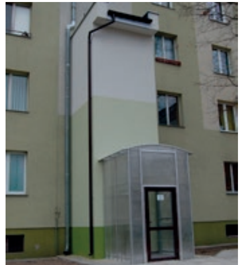
Winda do budynku przy ul. Jana Pawła II 4

Jeśli chodzi o chodniki zrealizowano końcowy odcinek chodnika przy ul. Konopnickiej, odremontowano chodnik przy ul. Szkolnej, wykonano chodnik do stacji PKP w Jadachach, zmodernizowano chodnik przy ul. Krasickiego 3. Nowy chodnik łączący Os. Poręby Dębskie z centrum miasta został wykonany pomiędzy ul. Leśną a Sikorskiego -