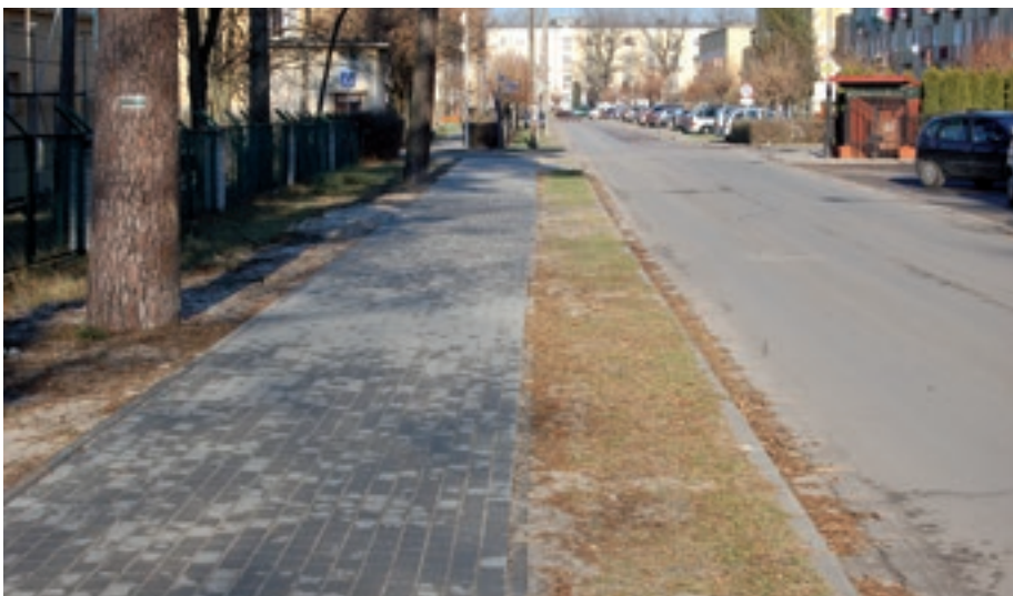
Chodnik przy ulicy Mickiewicza - łącznik ulicy Leśnej i Sikorskiego

W latach 2011- 2014 Gmina przy udziale środków WFOŚiGW w Rzeszowie oraz NFOŚiGW finansowała demontaż, transport i utylizację wyrobów zawierających azbest pochodzący z pokryć dachowych i elewacji budynków na terenie Miasta i Gminy Nowa Dęba. Łącznie z terenu miasta i gminy odebrano 222 t wyrobów zawierających azbest z 104 budynków za kwotę 81 tys. zł, w tym dotacja wyniosła 66 tys. zł.