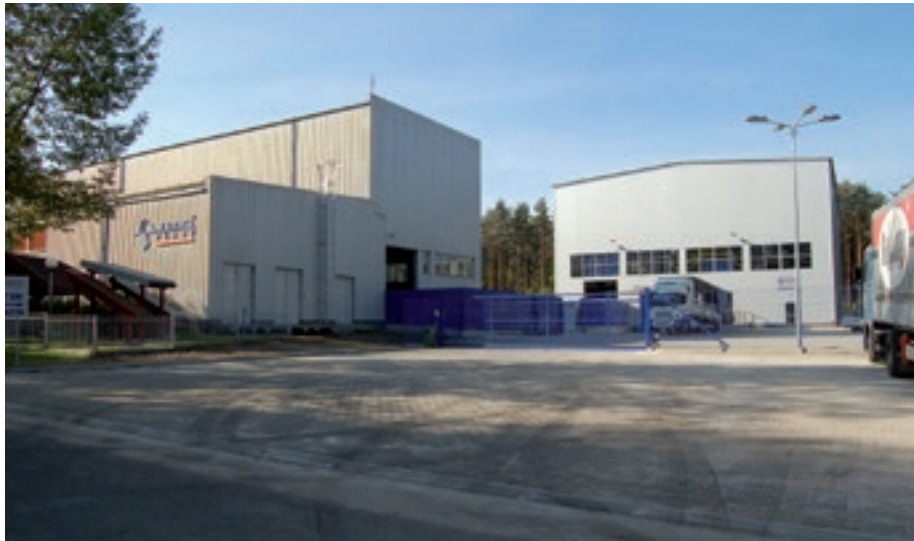
Marma Polskie Folie - w tle nowa hala magazynowa

Na terenie miasta Nowa Dęba istotną rolę odgrywa również Spółdzielnia Inwalidów „Zjednoczenie”, specjalizująca się w produkcji dla przemysłu motoryzacyjnego (różnego rodzaju przewody stalowe). Ważne jest to, że załoga Spółdzielni jest zakładem pracy chronionej i zatrudnia wielu niepełnosprawnych, którzy mogą się tu zawodowo realizować.