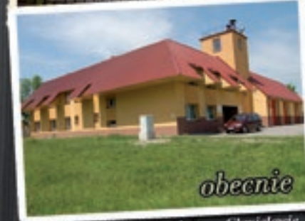
Wiejskie Centrum Kultury w Chmielowie