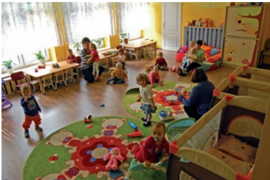
Żłobek miejski w Nowej Dębie ruszył 1 września 2014 r.