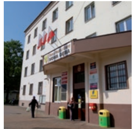
Urząd Miasta i Gminy Nowa Dęba