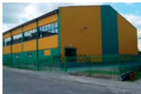
Hala sportowa przy ZS 1 w Nowej Dębie