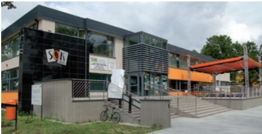
Samorządowy Ośrodek Kultury

W 2010 r. SOK został jednym z sześciu założycieli Uniwersytetu Trzeciego Wieku w Nowej Dębie, dla którego stał się główną bazą lokalową i podstawą działalności. Od 2013 roku dla trzech najważniejszych mecenasów naszej kultury gminnej, wręczane są statuetki „Mecenas Kultury”. W 2014 roku zainaugurowany został „Festiwal muzyki kameralnej i organowej Margaritae Baroci”. W tym roku organizowana jest druga edycja Festiwalu licząca siedem koncertów a fakt, że współfinansowana jest ze środków Ministra Kultury i Dziedzictwa Narodowego świadczy o tym, że poziom arty-