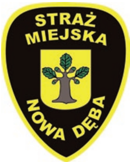
Logo Straży Miejskiej

Straż Miejska w Nowej Dębie została utworzona na podstawie przepisów ustawy o Policji z 1990 r. oraz Uchwały Rady Miejskiej w Nowej Dębie Nr XXXIII/239/92 z dnia 20 listopada 1992 r. w sprawie utworzenia Straży Miejskiej Miasta Nowa Dęba.