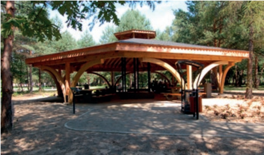
Wiata ogniskowa nad Zalewem