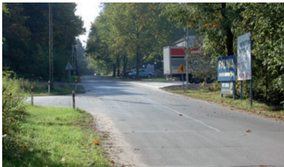
Drogi wewnątrz nowodębskiej strefy

Gmina nasza stoi obecnie mocno na dwóch gospodarczych nogach: Nowej Dębie i Chmielowie. Znajdujące