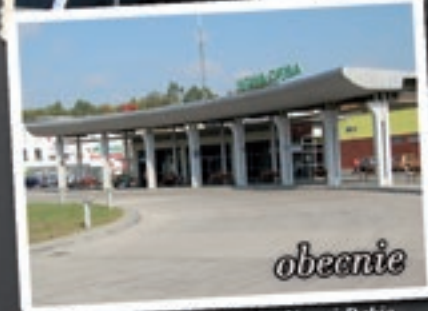
Dworzec autobusowy w Nowej Dębie