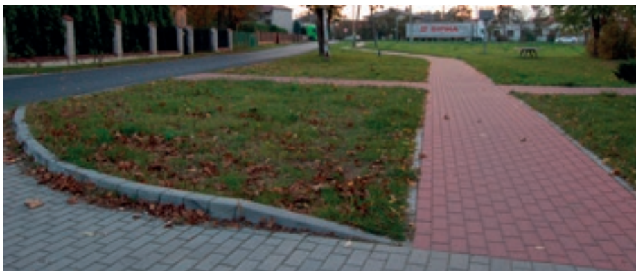
Chodnik w osiedlu Poręby Dębskie

Po 1990 roku Gmina Nowa Dęba nabywała grunty w drodze komunalizacji Skarbu Państwa, wykupu gruntów od osób prywatnych, wywłaszczeń na cele publiczne oraz w drodze zasiedzenia i darowizny. Samorząd dokonywał też zbycia gruntów, głównie pod budownictwo mieszkaniowe jednorodzinne: na os. Hubala, przy ul. Strażackiej i Podleśnej - Poręby Dębskie; w Chmielowie w Sadzie, w Cyganach na osiedlu obok stadionu. Zbyte zostały również