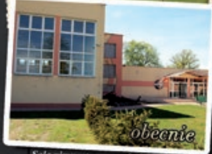
Sala gimnastyczna w Jadachach