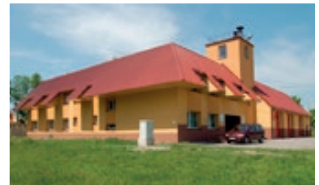
Wiejskie Centrum Kultury w Chmielowie