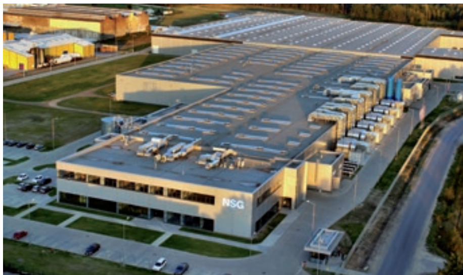
Zakład Pilkington Automotive Poland w Chmielowie

Realizując zobowiązania wobec firm w chmielowskiej podstrefie gmi-