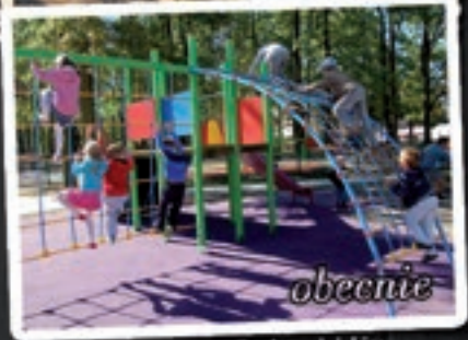
Plac zabaw w Parku miejskim