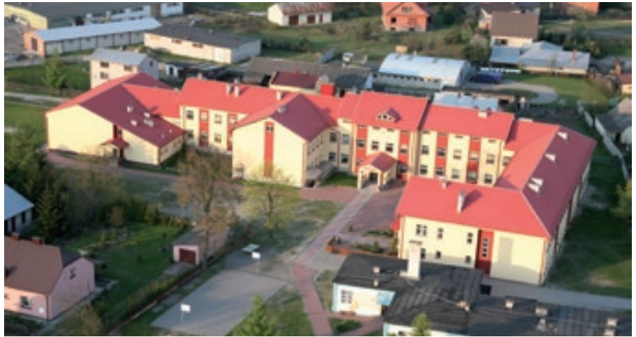
Zespół Placówek Oświatowych z lotu ptaka