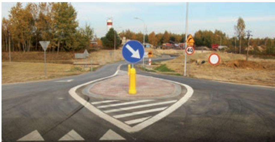
Droga Strefowa jako łącznik z drogą krajową nr 9

Na terenie miasta i w naszych wioskach działa wiele innych, małych firm różnych branż, które także są naszym skarbem gospodarczym.