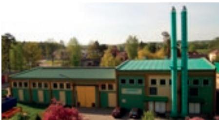
Kotłownia miejska na biomasę