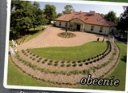
Dworek "Belweder" w Chmielowie