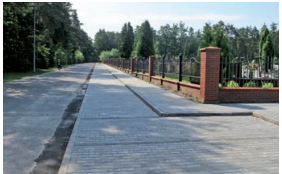
Chodnik i parking przy ulicy Cmentarnej