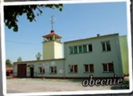
Rozalin - Wiejskie Centrum Aktywności i Rekreacji OSP