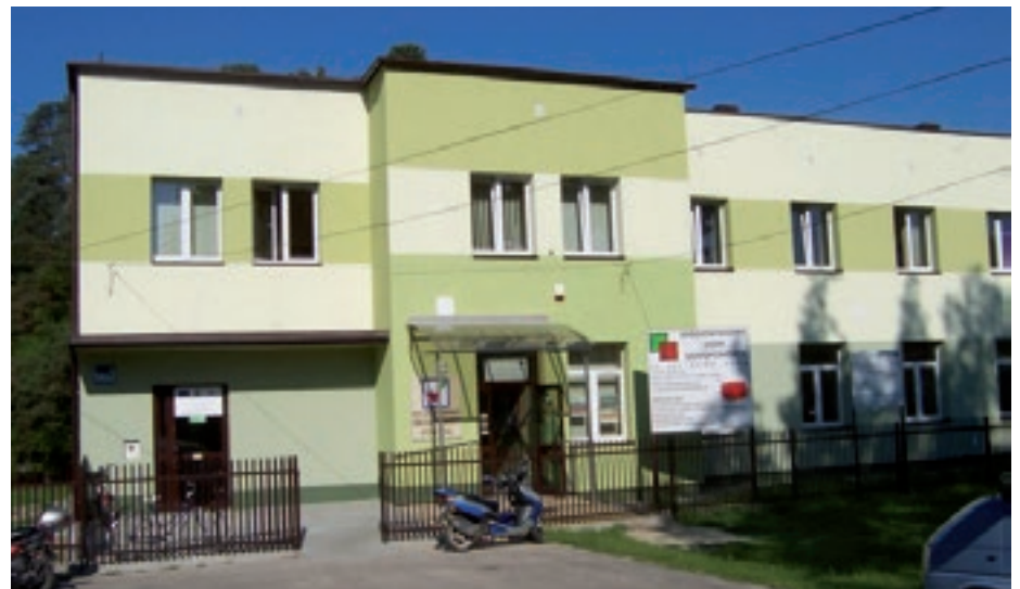
Budynek Miejsko-Gminnego Ośrodka Pomocy Społecznej

Wachlarz spraw, którymi zajmują się pracownicy Ośrodka, a są to m. innymi: pracownicy socjalni, opiekunki środowiskowe, asystenci rodziny, jest bardzo szeroki i obejmuje działania od porad socjalnych i prawnych, poprzez dożywianie dzieci i dorosłych, usługi opiekuńcze w miejscu