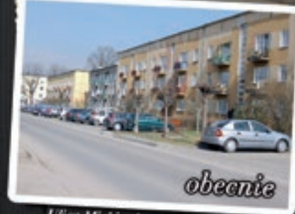
Ulica Mickiewicza w Nowej Dębie

Nasze Sprawy: Pismo Samorządu Miasta i Gminy Nowa Dęba