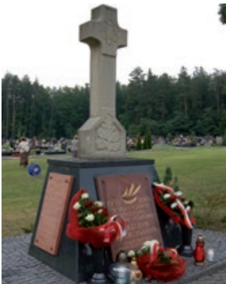
Krzyż II wojny światowej w Nowej Dębce

1 września 2009 r., w 70. rocznicę wybuchu II wojny światowej na cmentarzu komunalnym w Nowej Dębce został odsłonięty pomnik w postaci krzyża, którego celem było upamiętnienie