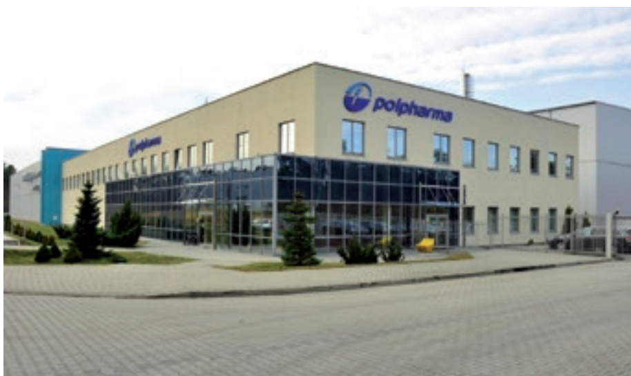
Oddział produkcyjny Polpharmy w Nowej Dębie

Chmielów. Minione 25 lat to czas upadku i wzrostu gospodarczego dawnych terenów górniczych. Podjęta w 1992 r. decyzja o zamknięciu kopalni siarki „Machów” spowodowała znaczący odpływ z tego terenu miejsc pracy, na szczęście rozłożony w czasie. Z dawnych Kopalń i Zakładów Przetwórczych Siarki „Siarkopol” wyodrębniono kilka spółek, które dziś nieźle radzą sobie w gospodarczym