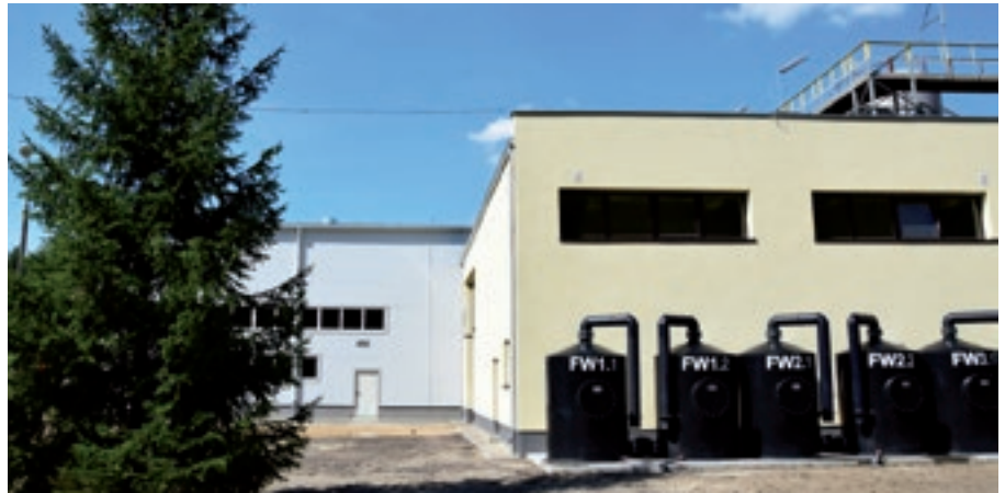
Stacja Uzdatniania Wody

niania wody zaopatrującej Miasto i Gminę Nowa Dęba w wodę zdatną do spożycia.