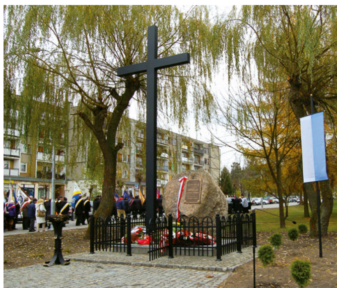
Krzyż - pomnik jubileuszu 1050-lecia Chrztu Polski na Osiedlu Północ