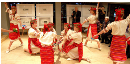
Spotkania z kulturą ukraińską