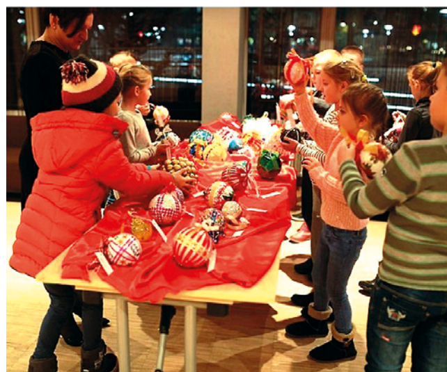
Konkurs na najpiękniejszą bombkę choinkową