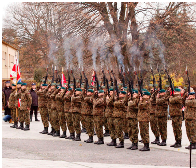
Salwa honorowa na placu mjr Jana Gryczmana w wykonaniu żołnierzy z nowodębskiej jednostki