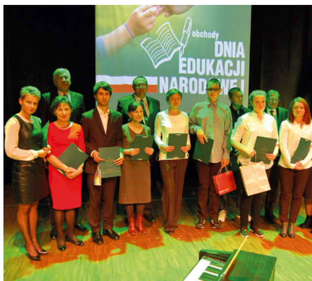
Wyróżnieni uczniowie wraz z rodzicami i nauczycielami