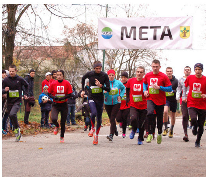
11 listopada na sportowo czyli marsz i bieg "Ku Niepodległości"