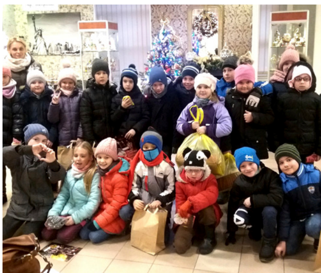
Świąteczny klimat jest obecny w Muzeum Bombki Choinkowej przez cały rok