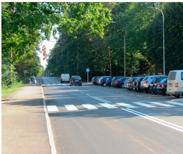
Wyremontowana ulica Kościuszki w pobliżu ZS nr 2