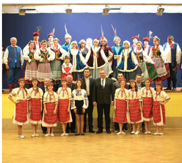
Spotkanie z kulturą ukraińską w WCK w Chmielowie