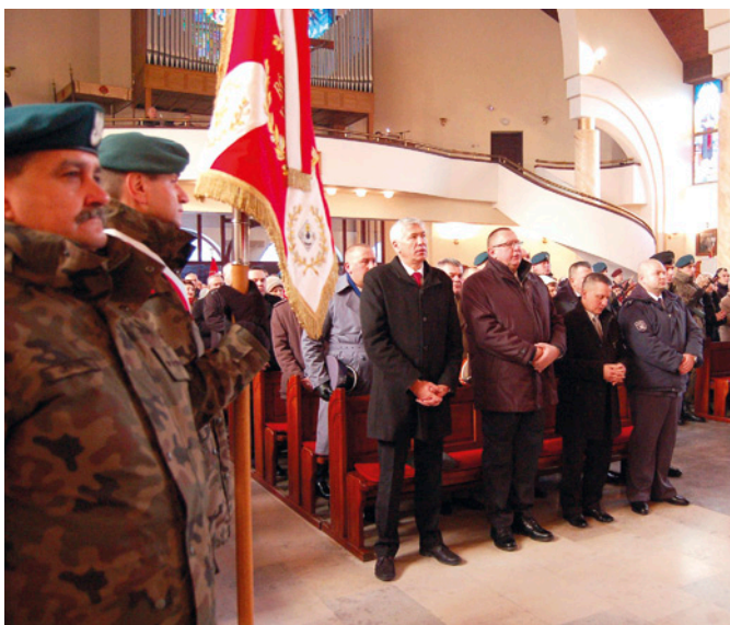
Uroczysta Msza św. rozpoczęła obchody Święta Niepodległości