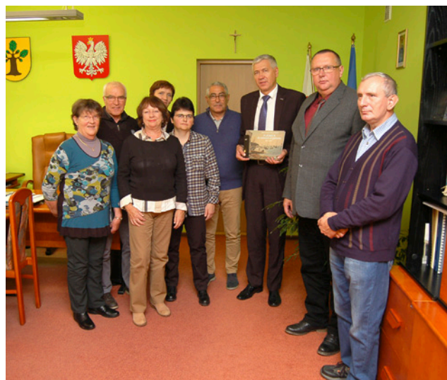
Goście z Ploemeur z wizytą u burmistrza Nowej Dęby