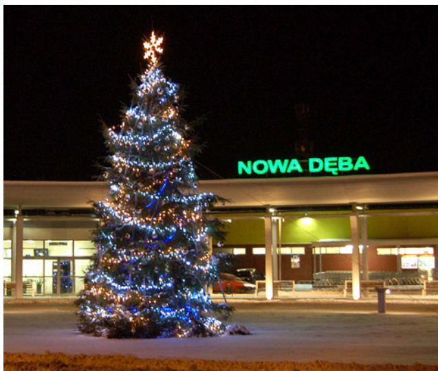
Choinka przy dworcu autobusowym w Nowej Dębie