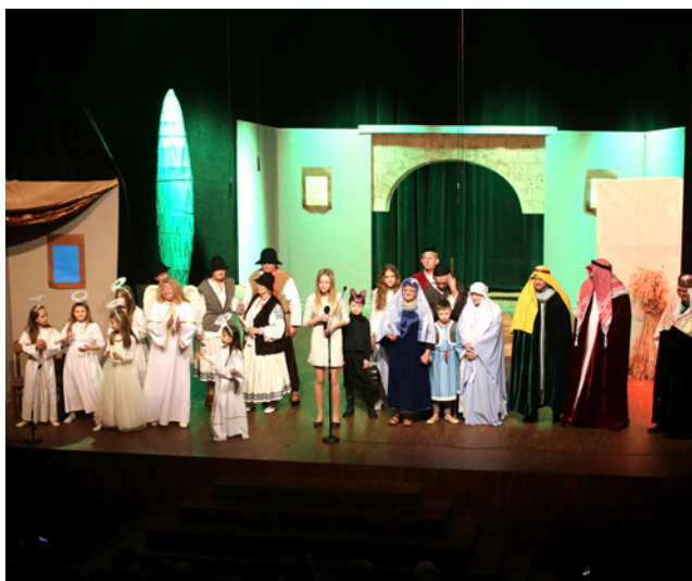
Wigilia Gminna 2016