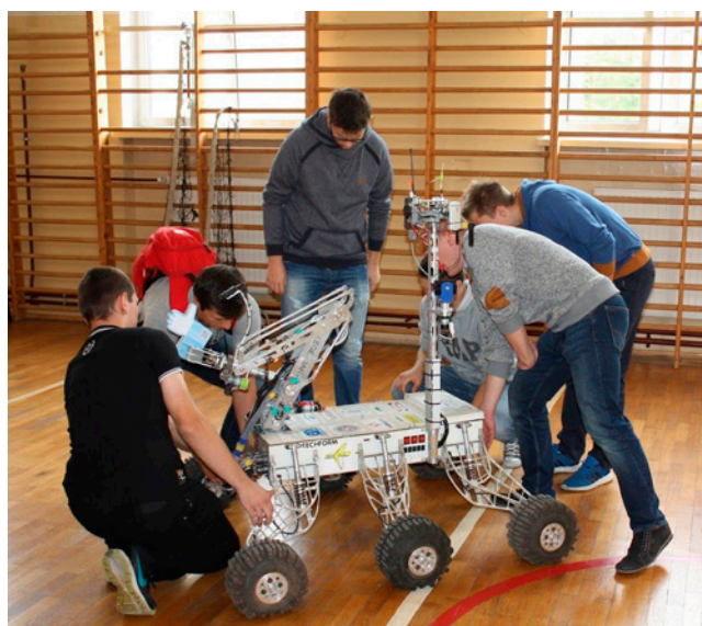
Jesień pełna wrażeń w ZS nr 1 - prezentacja łazika marsjańskiego Politechniki Rzeszowskiej