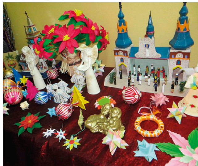
Wystawa rękodzieła świątecznego w CKL w Cyganach