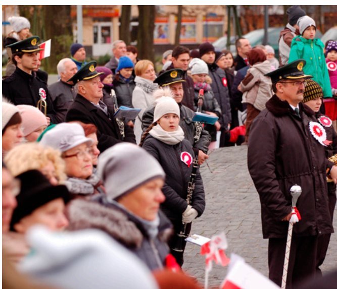
O oprawę muzyczną Święta Niepodległości dbała Orkiestra Dęta Miasta i Gminy Nowa Dęba