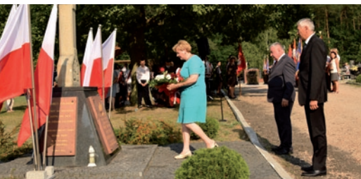
80 lat temu wybuchła II wojna światowa ➔ str. 10