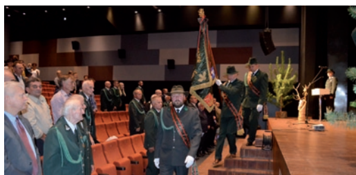
70 lat Koła łowieckiego RYŚ ➔ str. 12