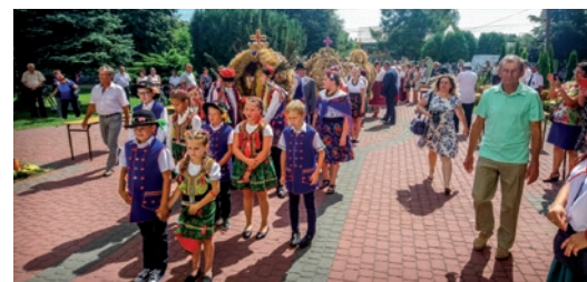
Dożynki gminne ➔ str. 23