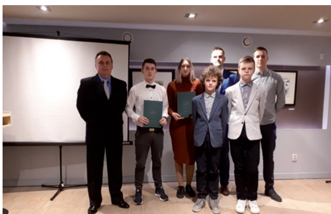
Sekcja badmintonu MKS STAL Nowa Dęba