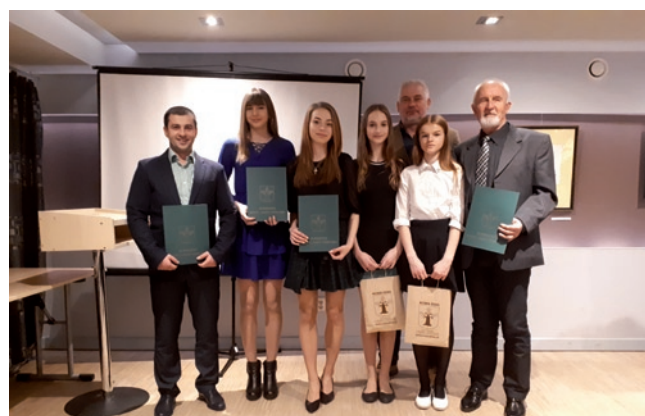
Sekcja lekkiej atletyki MKS STAL Nowa Dęba