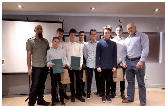
Sekcja pływacka Piranie SOSiR Nowa Dęba