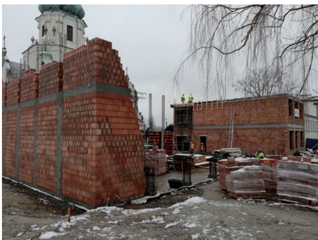
Budowa sali gimnastycznej przy szkole w Chmielowie