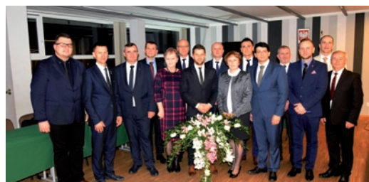
Rada Miejska VIII kadencji