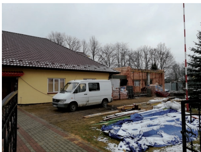
Rozbudowa remizy OSP w Jadachach