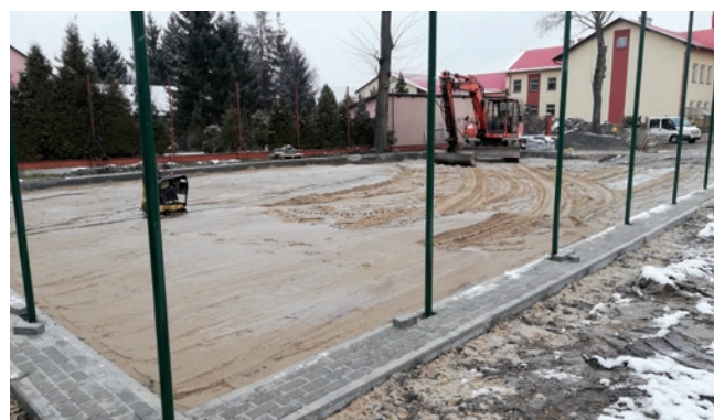
Budowa boiska przy ZPO w osiedlu Dęba