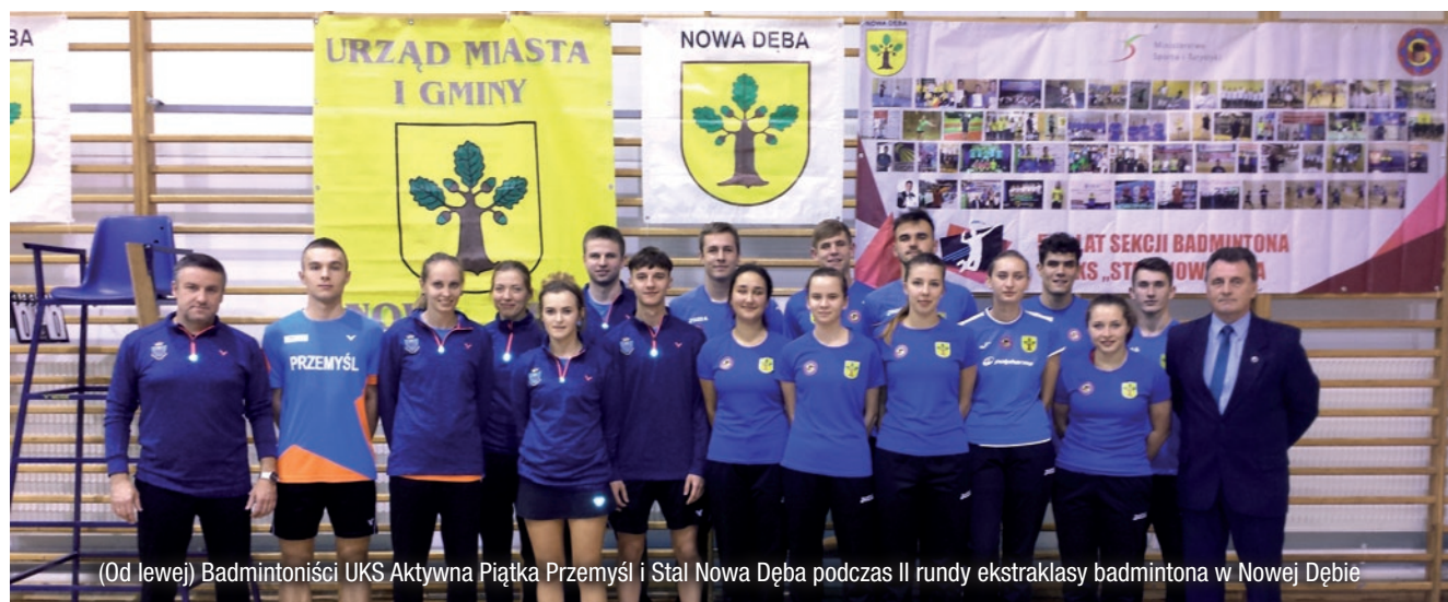
(Od lewej) Badmintoniści UKS Aktywna Piątka Przemysł i Stal Nowa Dęba podczas II rundy ekstraklasy badmintonu w Nowej Dębie