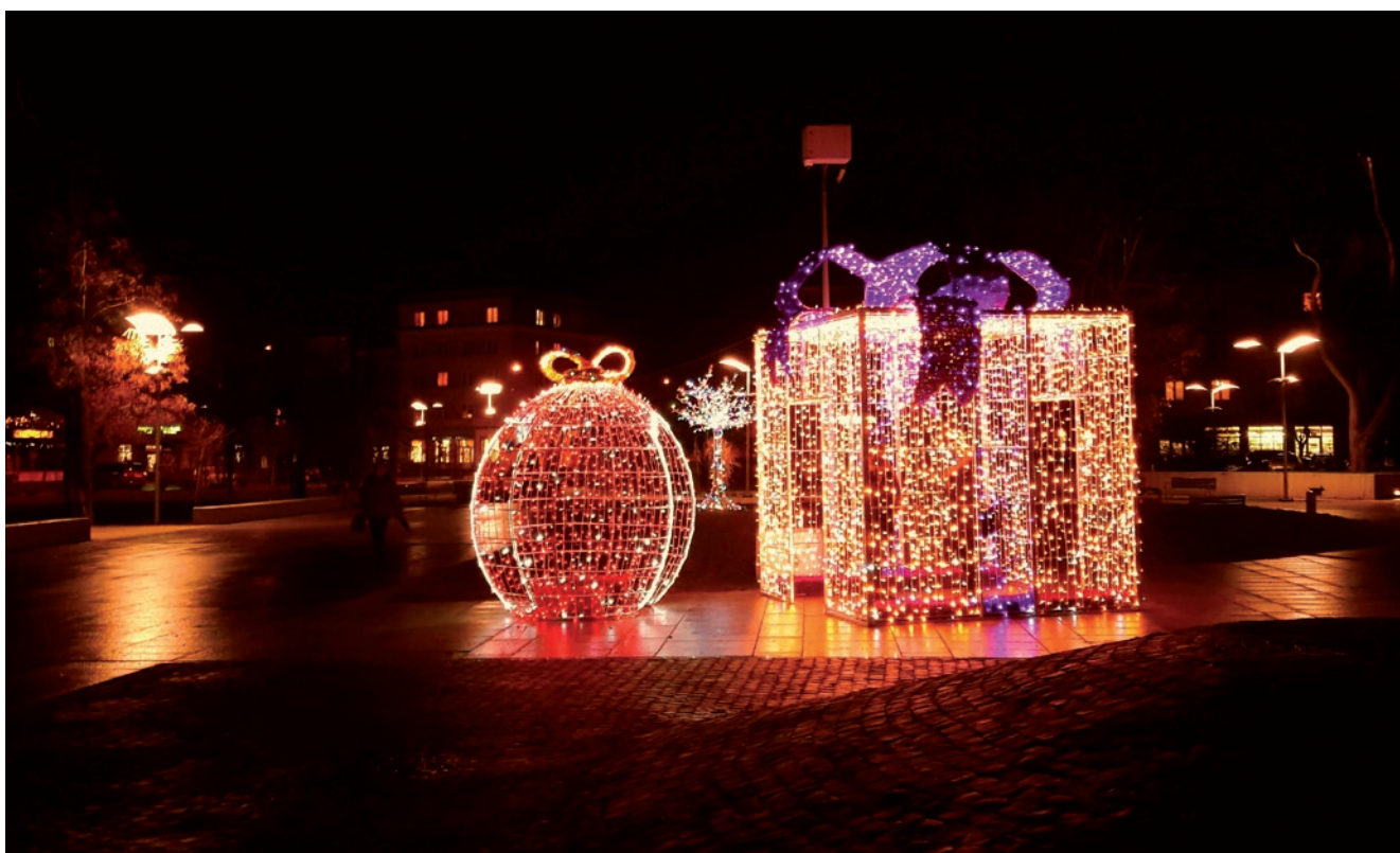
Świąteczne dekoracje na placu majora Gryczmana w Nowej Dębie