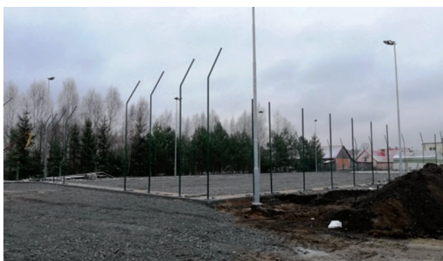
Budowa boiska wielofunkcyjnego przy szkole w Tarnowskiej Woli