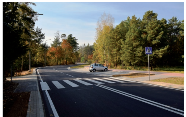
Wyremontowana ulica Kościuszki – odnowione przejście dla pieszych i parking