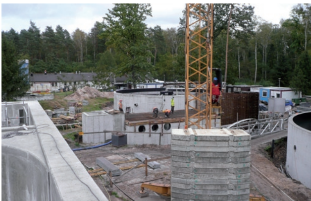
Rozbudowa i modernizacja miejskiej oczyszczalni ścieków