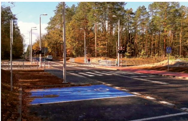
Wyremontowana ulica Kościuszki – nowy parking przy przystanku kolejowym i przejazd w nowym miejscu