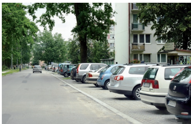
Parking wzdłuż ul. Jana Pawła II