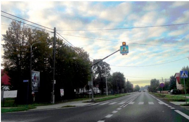
Oświetlone przejście na DK9 przy skrzyżowaniu z ul Anieli Krzywoń