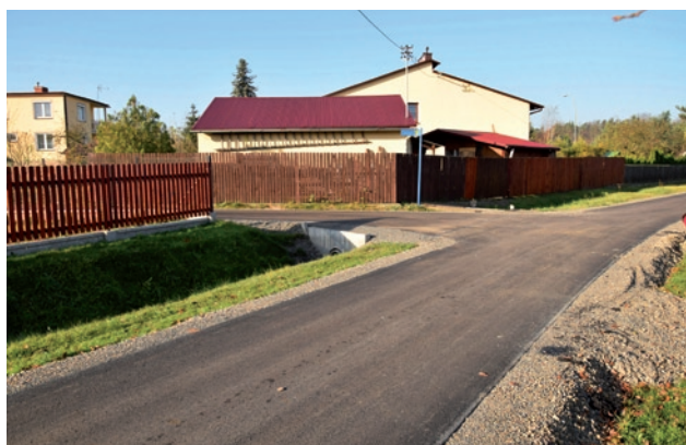
Remonty dróg – ulice Spizowa i Pszenna