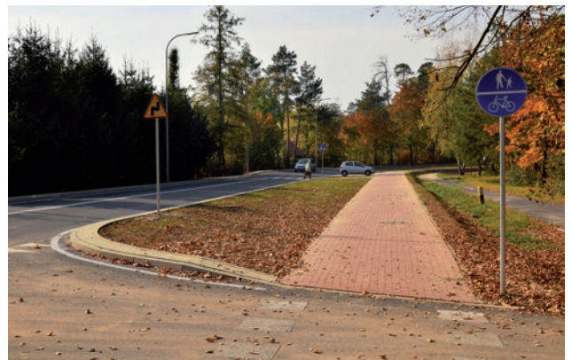
Wyremontowana ulica Kościuszki – nowy chodnik wzdłuż ogródków działkowych