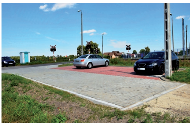
Parking przy PKP Tarnowska Wola