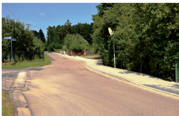
Nowy chodnik przy ul. Smugowej