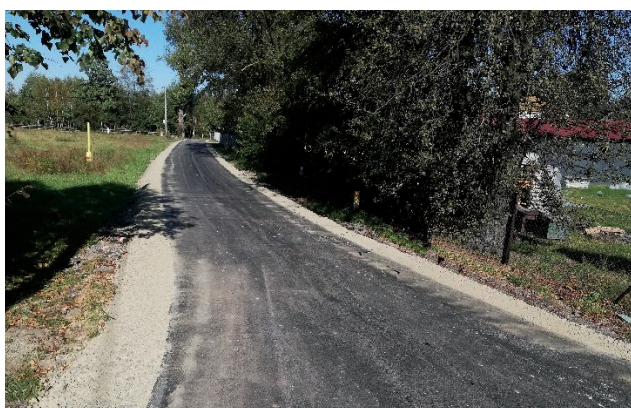
Remonty dróg – ulica obok sklepu w Jadachach