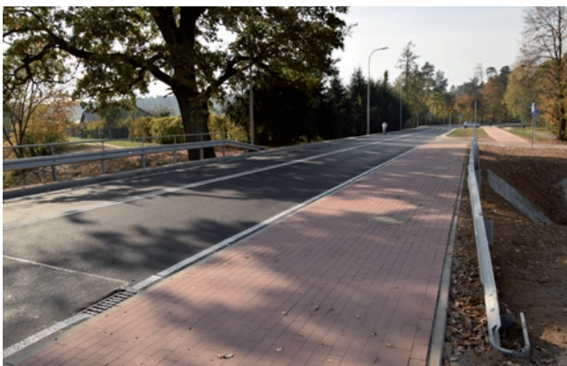
Wyremontowana ulica Kościuszki – nowa nawierzchnia na moście i ciąg pieszo-rowerowy