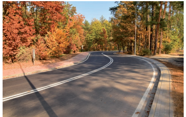
Wyremontowana ulica Kościuszki – korekta łuków