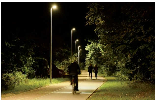
Oświetlona alejka wokół zalewu