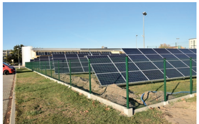
Panele fotowoltaiczne przy krytej pływalni