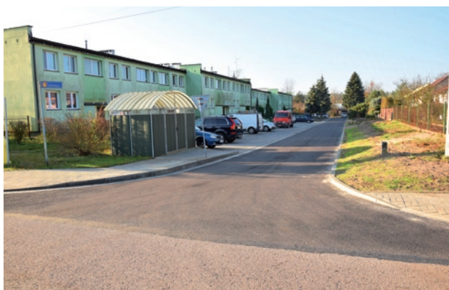
Remonty dróg – ul. Spółdzielcza