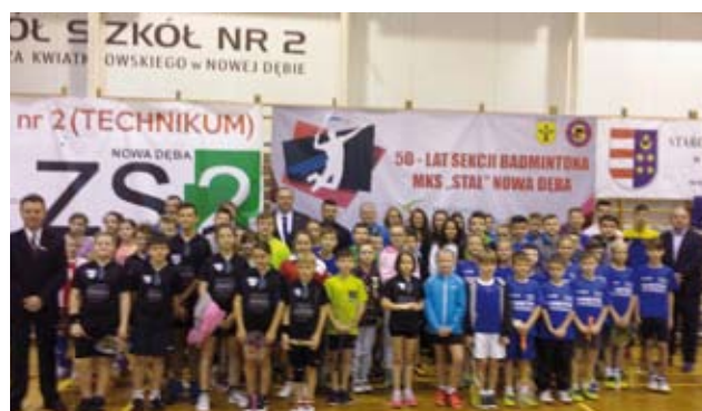
Najmłodszy zawodnicy podczas Grand Prix Nowej Dęby Żaków, Młodzików i Juniorów