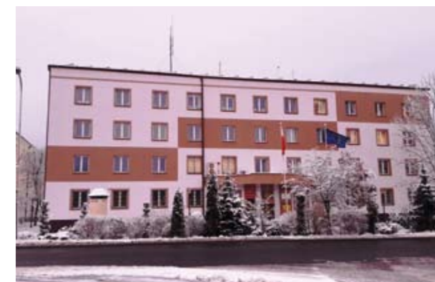
Nowa elewacja budynku Urzędu Miasta i Gminy