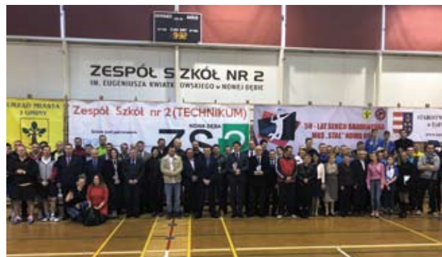
Pamiątkowe zdjęcie uczestników jubileuszu