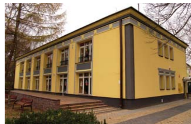
Nowa elewacja Przedszkola nr 1 w Nowej Dębie