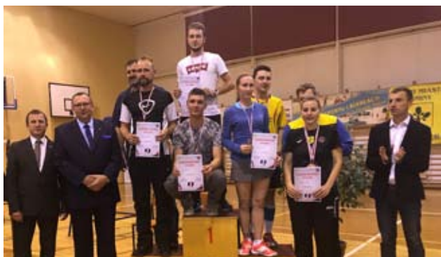
Grand Prix Nowej Dęby - badmintonowi weterani na podium