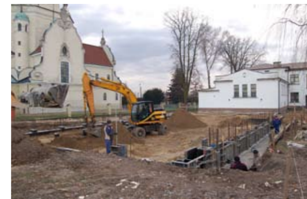
Fundamenty nowej sali gimnastycznej przy szkole w Chmielowie