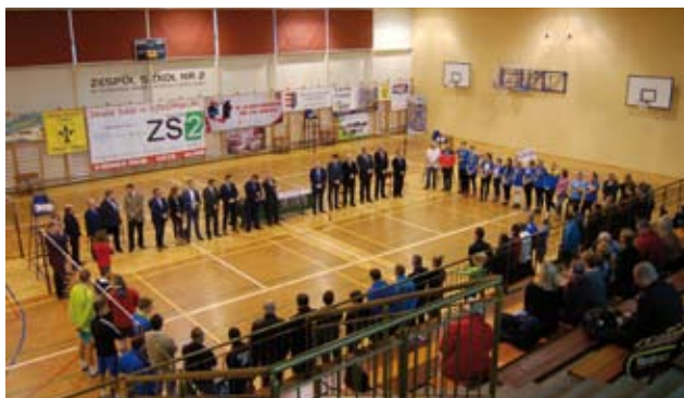
Uroczysta ceremonia otwarcia obchodów 50-lecia sekcji badmintonu