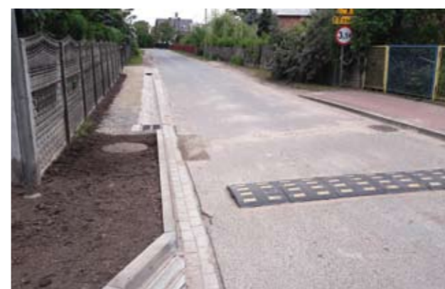
Odwodnienie drogi Piasek w Cyganach