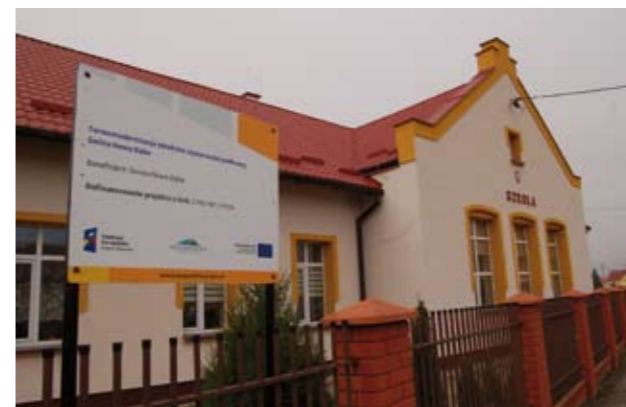
Szkoła w Jadachach po termomodernizacji