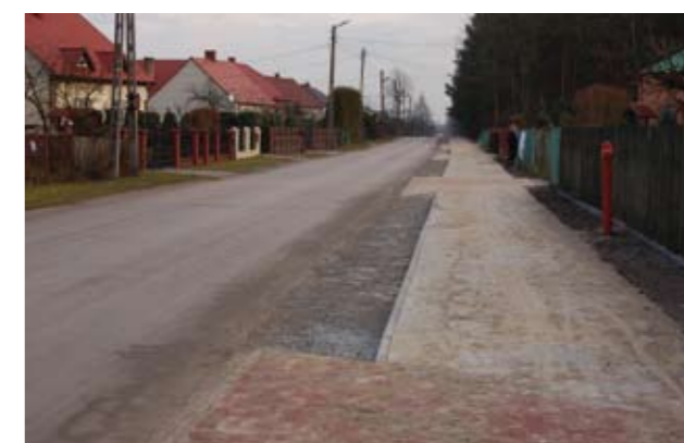
Nowy odcinek chodnika w Rozalinie