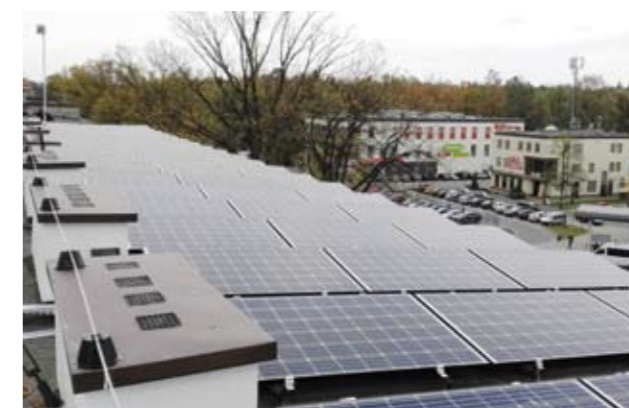
Panele fotowoltaiczne na budynku UMiG