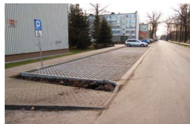
Miejsca parkingowe przy ulicy Jana Pawła II 28 - 32