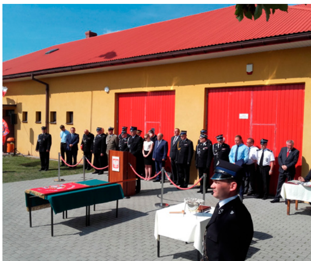
Zaproszeni goście podczas uroczystości przekazania nowego sztandaru dla OSP Poręby Dębskie.