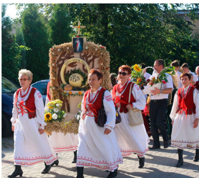
Bielowianki z Rozalina z dożynkowym wierzem.