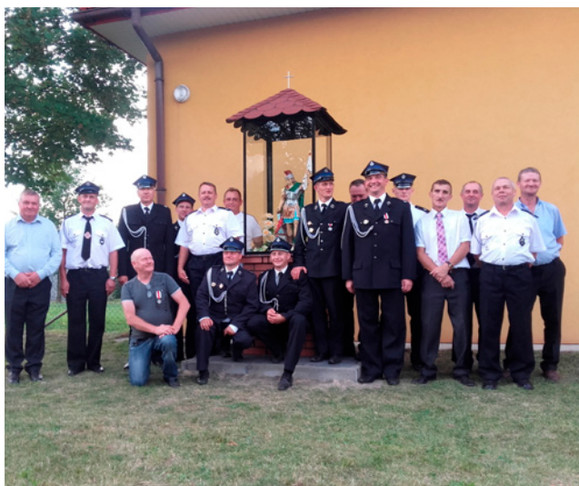
Pamiętkowe zdjęcie przy figurze św. Floriana.