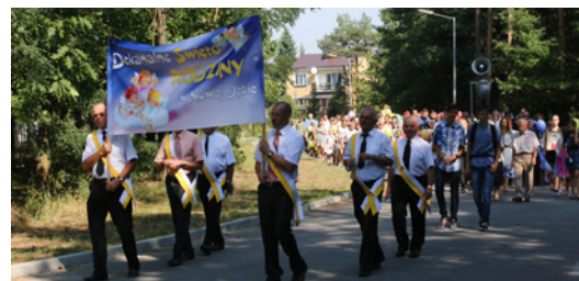
Dekanalne Święto Rodziny ➔ str. 20