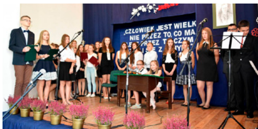
Uroczystość w ZS w Chmielowie ➔ str. 17