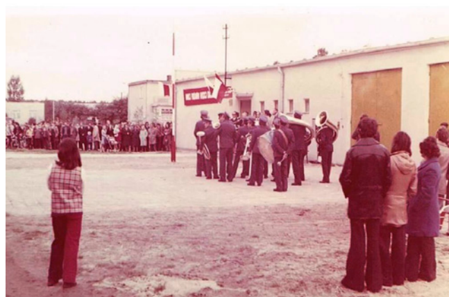
Zdjęcie archiwalne z 25 września 1977 r.