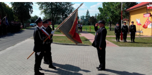
Sztandar dla OSP Poręby Dębskie ➔ str. 9