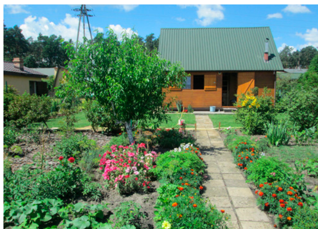
ROD Metalowiec - I miejsce, działka nr 90.