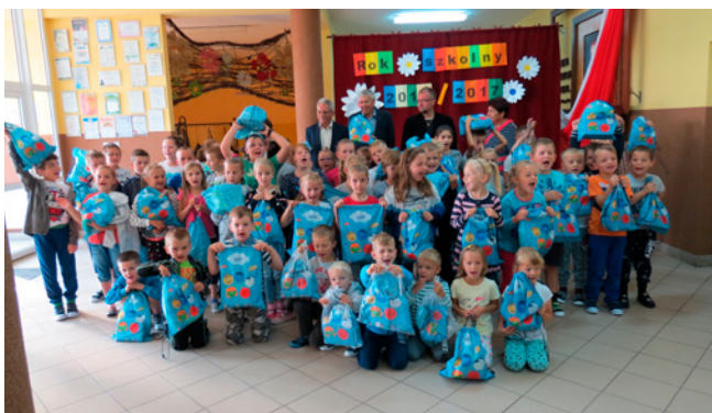
Wyprawki od ZOT "Siarkopol" dla najmłodszych uczniów ze szkoły w Jadachach