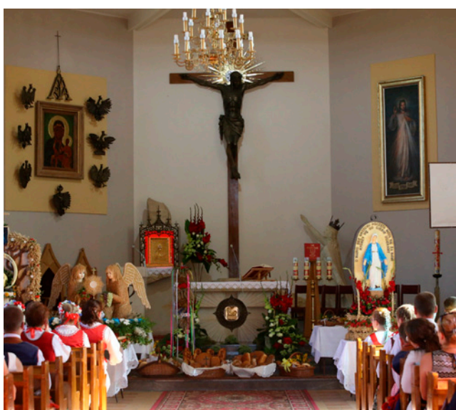
Uroczystości dożynkowe rozpoczęła Msza św. w kościele parafialnym w Cyganach.