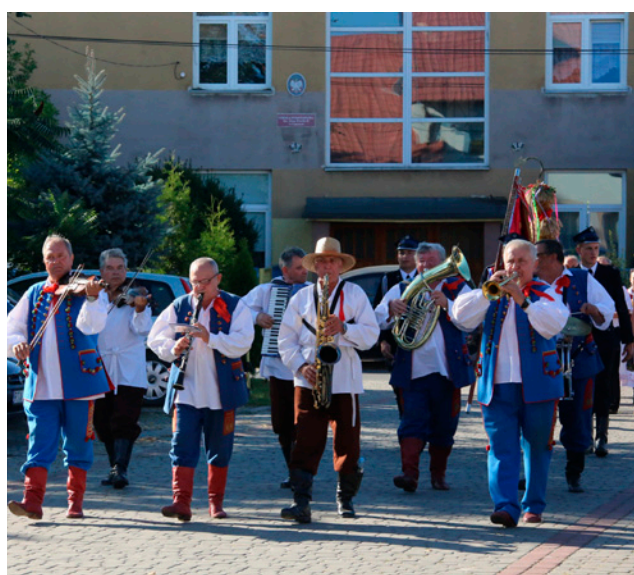
Kapela "Dębianie" na czele dożynkowego korowodu.