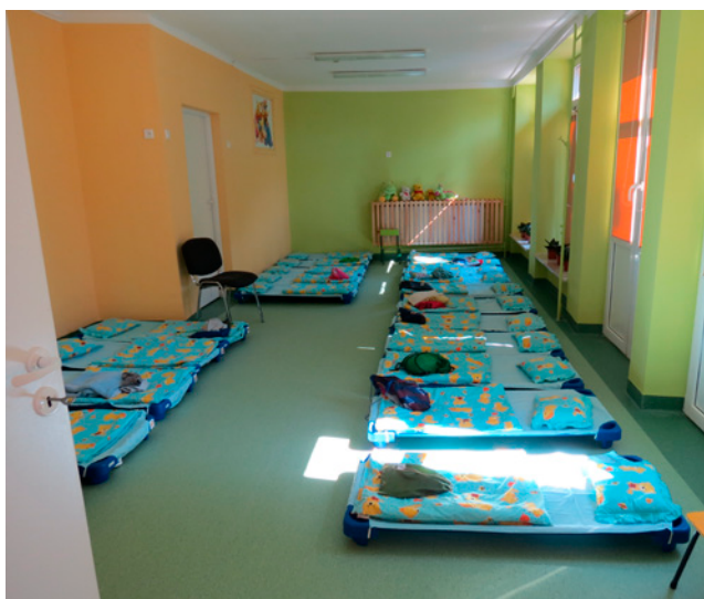
Wyremontowane pomieszczenia dla 6-latków w Przedszkolu nr 5 w Nowej Dębie.