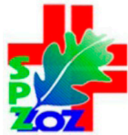
Samodzielny Publiczny Zespół Zakładów Opieki Zdrowotnej w Nowej Dębie

Będzie to pierwszy etap remontu Komisariatu Policji w Nowej Dębie, który swoim zakresem obejmie: docieplenie elewacji budynku, zadaszenie nad wejściem głównym tworzące portal wejściowy z logo Policji, wykonanie izolacji przeciwwilgociowej ścian fundamentowych, wymianę rynien, rur spustowych oraz obróbki blacharskie. Ponadto dokonana zostanie wymiana pozostałej czę-