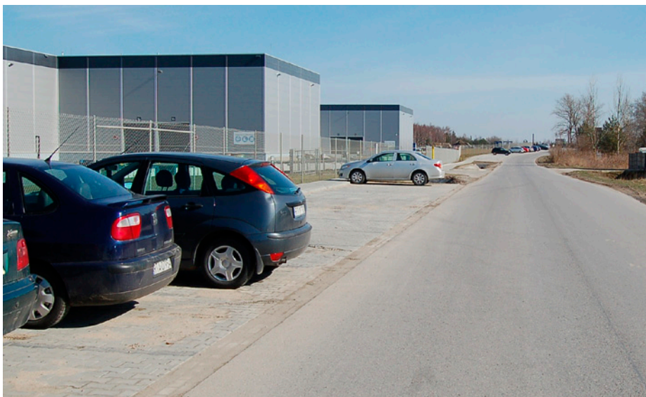
W ramach realizacji ubiegłorocznego budżetu przybyło 350 metrów chodnika wraz z parkingiem przy ulicy Siarkowej - Strefowej w Chmielowie (w sąsiedztwie zakładu Pilkington Automotive Poland)

Tegoroczny budżet jest zbliżony w swoich kwotach do realizacji budżetu ubiegłorocznego. Przewidujemy dochody na poziomie 53,5 mln zł. Największy wpływ na te cyfry mają dochody własne gminy, związane z podatkami od firm i osób fizycznych, a także z udziałami w podatku dochodowym od mieszkańców i firm. Rządowe subwencje to kwota 11,8 mln zł, z czego oświatowa subwencja w wysokości 10 mln zł wystarcza na ok. 58% wszystkich wydatków na oświatę, które wyniosą w 2016 r. kwotę 18,5 mln zł, do których należy dołożyć 800 tys. na zakończenie budowy Sali gimnastycznej przy SP2 oraz projekty przedszkola i sali gimnastycznej w Chmielowie.