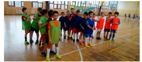
Ferie z piłką w SOSiR