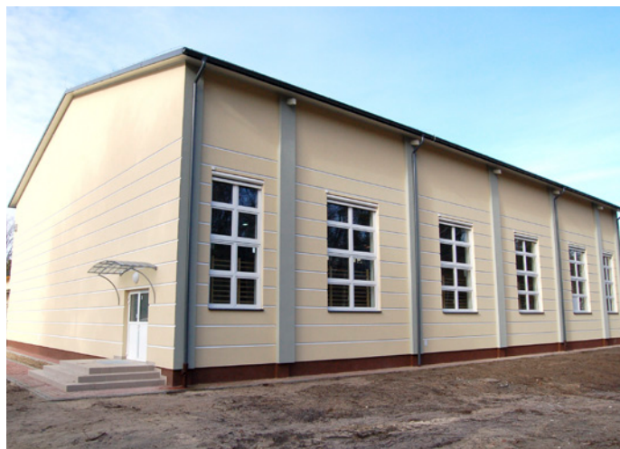
Fasada nowej hali w całej okazałości