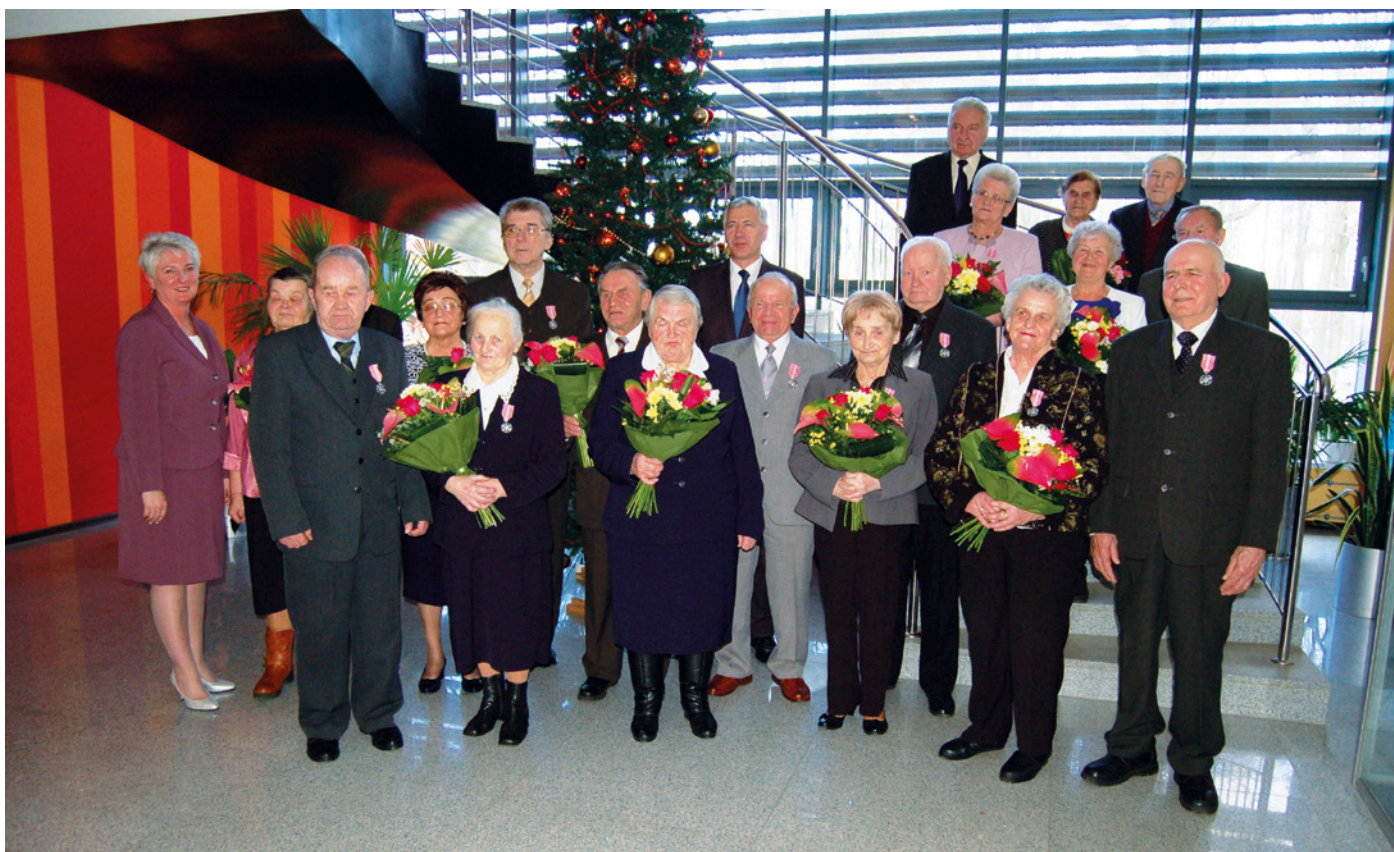
Świętowali Złote Gody