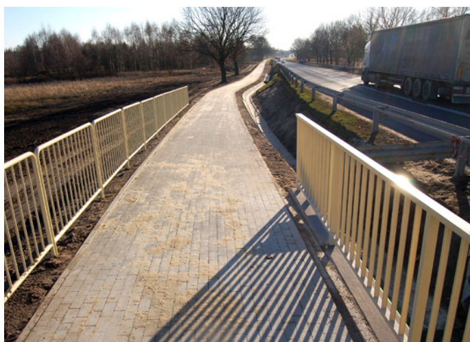
Kładka na rzece Dęba i dokończony ciąg pieszo-rowerowy pomiędzy Nową Dębą i Tarnowską Wołą poprawiły bezpieczeństwo