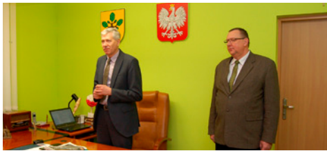
Zmiany kadrowe w gminie