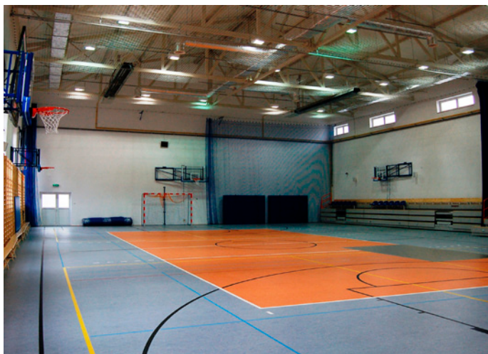
Wnętrze nowej hali sportowej przy SP 2 w Nowej Dębie