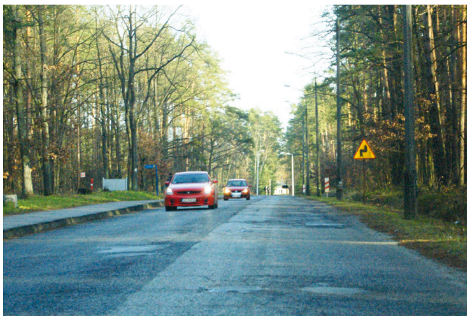
W tym roku rusza I etap przebudowy ulicy Kościuszki w Nowej Dębie

objektach gminnych. Gmina zamierza także rozpocząć budowę kanalizacji sanitarnej w Alfredówce, przeznaczając w tym roku środki w wysokości 700 tys. zł, licząc na dotacje unijne lub z funduszy środowiskowych.