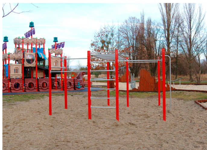
Street Workout czyli zestaw drążków i drabinek do podciągania w pobliżu strefy ćwiczeń i statku pirackiego nad Zalewem