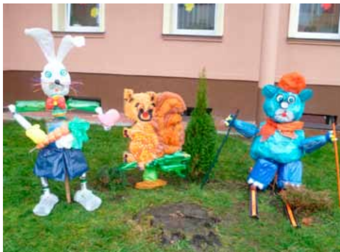
2014 – Zwierzakolubni

Koordinator konkursu: Brygida Zięba Przedszkole nr 5 im. Misia Uszatka w Nowej Dębie