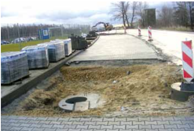
Budowa parkingu wraz z chodnikiem przy drodze Siarkowej - Strefowej w Chmielowie