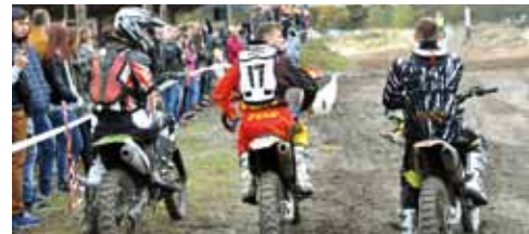
MCQ Nowa Dęba 2015