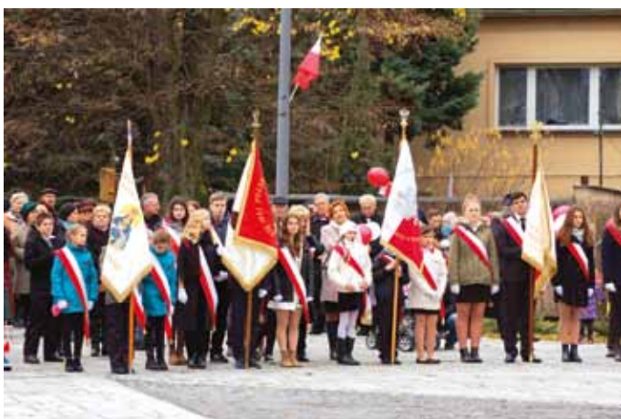
W uroczystych obchodach Święta Niepodległości na placu mjr Gryczmana uczestniczyły liczne poczty sztandarowe szkół z terenu miasta i gminy Nowa Dęba