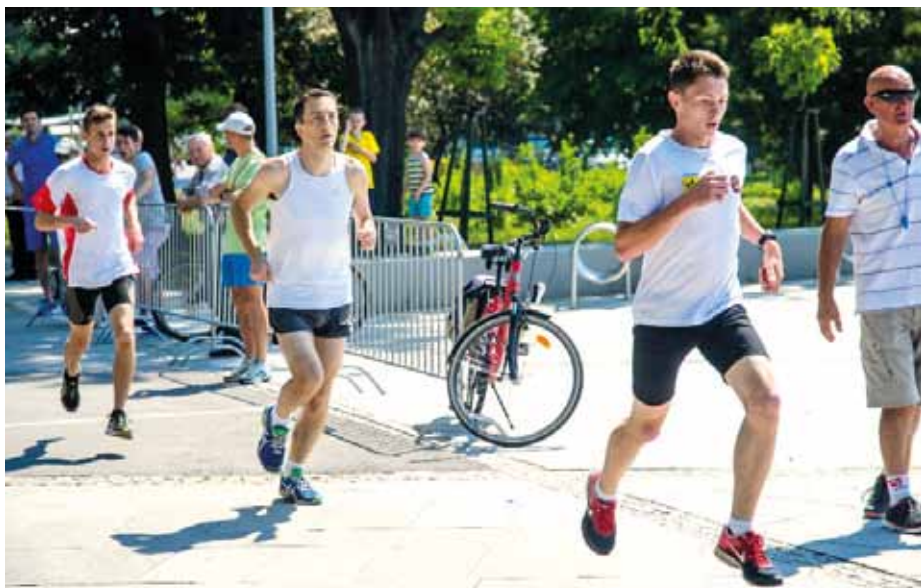
Nowodębskie Biegi Uliczne 2015

NTSK 16 lat temu rozpoczęło w naszym środowisku modę na bieganie w mieście. Dzięki społecznej pracy wielu osób Biegi w Nowej Dębie są rozgrywane w formie rywalizacji sportowej w bezpiecznej formule i z symbolicznymi nagrodami dla zawodników. Moda na bieganie w mieście budzi czasem frustracje osób zbulwersowanych zamknięciem ulic podczas biegów. Na szczęście takich osób z roku na rok jest coraz mniej. Przybywa za to zawodników, co bardzo cieszy nas, jako organizatorów. Mam nadzieję, że to nie chwilowa moda. W naszym środowisku powstała spora liczba