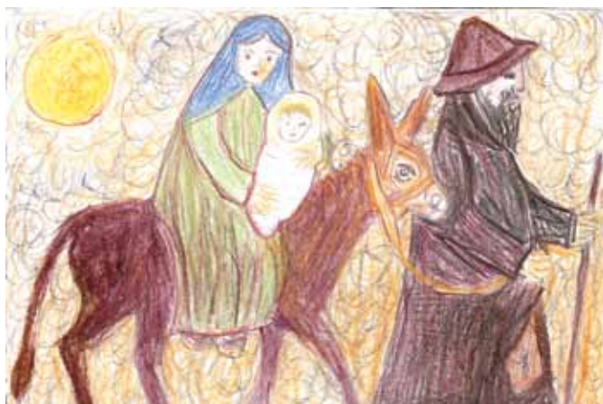
1 miejsce, Oliwia Paleczka, 9 lat, kl. IV, Zespół Szkół w Jadachach, opiekun B. Ordon