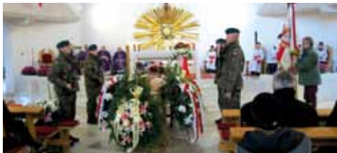
Honorowe pożegnanie "Bławata" » str. 4