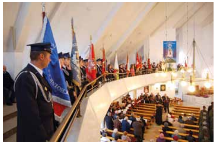
Święto Niepodległości - uroczysta Msza św. w kościele pw. Podwyższenia Krzyża Św.