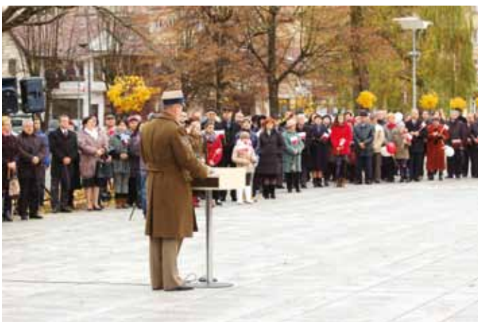
Odczytywany Apel Pamięci wzywa zawsze tych, którzy oddali swe życie za ojczyznę