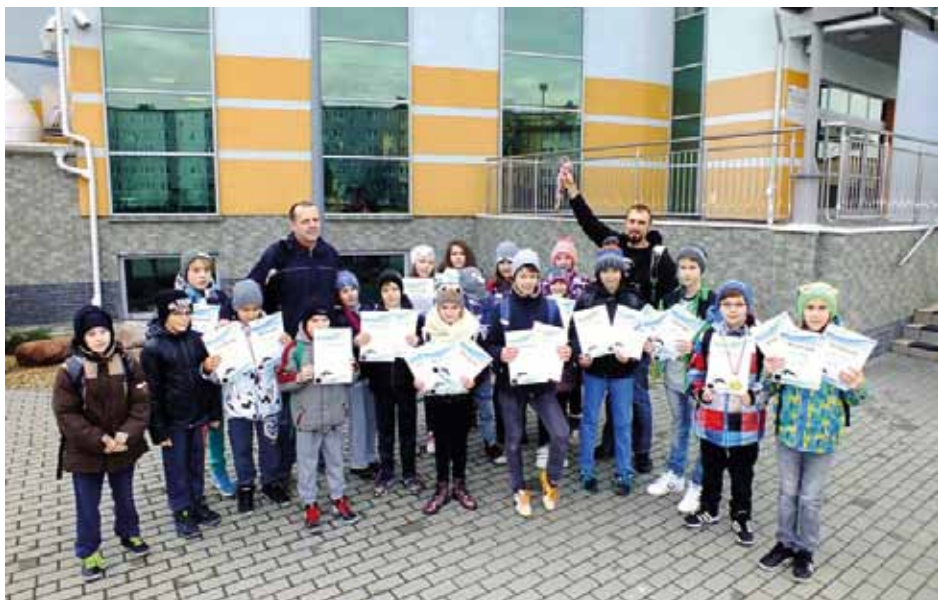
Drużyna nowodębskich „Piranii” po udanych zawodach w Kolbuszowej

Nasza drużyna wywalczyła w sumie 17 medali ( 7 złotych, 4 srebrne, 6 brązowych). Tak wspaniały wynik dał sekcji Piranie 3 miejsce w tabeli medalowej, co jest naszym historycznym osiągnięciem.