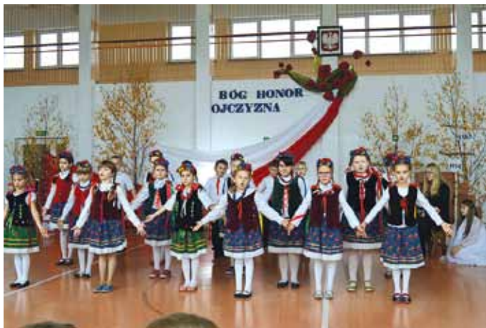
Święto Niepodległości w Zespole Szkół w Jadachach