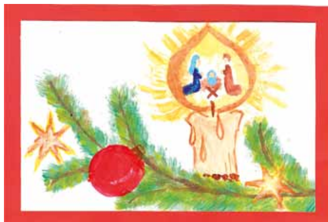
3 miejsce, Wiktoria Urbaniak, 9 lat, kl. III, SP w Rozalinie, opiekun S. Glijer