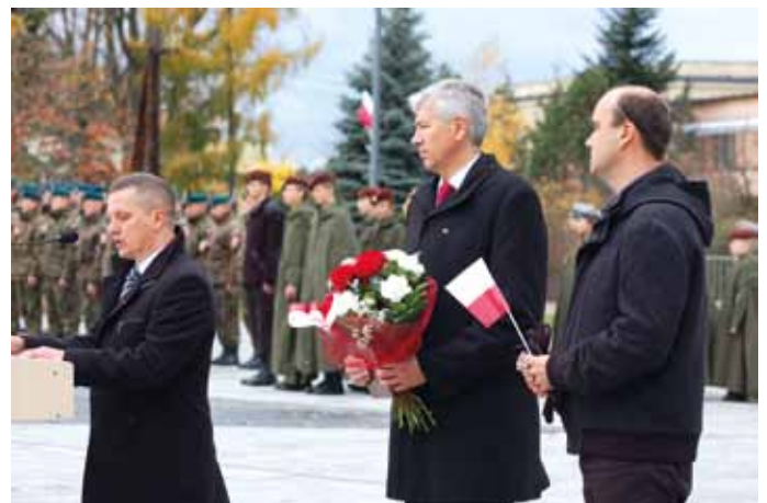
Święto Niepodległości - wręczenie tytułu Honorowego Obywatela Gminy Nowa Dęba