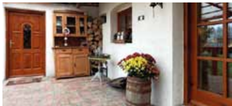
"Dobre Miejsce" z ekocertyfikatem » str. 15