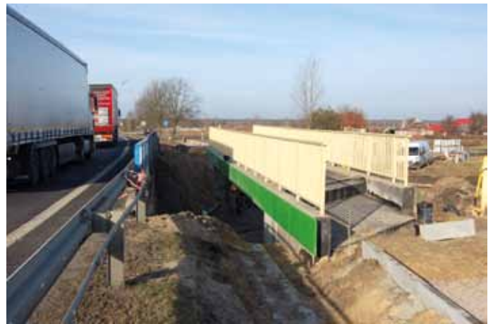
Budowa ciągu pieszo-rowerowego i mostu na rzece Dęba