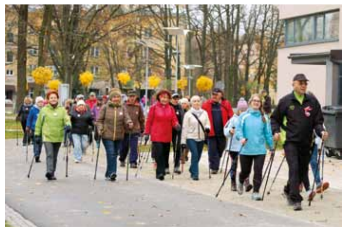
Uczestnicy marszu nordic-walking „Ku Niepodległości”