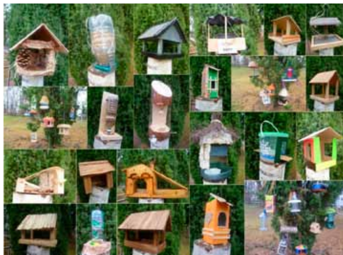
2015 – Zrób to sam