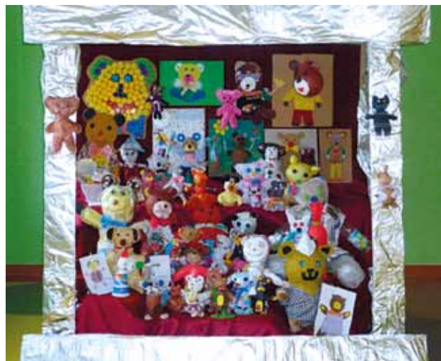
2013 - Misiowy obraz

W tym roku szczęście uśmiechnęło się do przedszkolaków Misia Uszatka. Nasze karmniki zdobyły II miejsce w ocenie jury. Trzeba zaznaczyć, że na konkurs wpłynęło 2400 zdjęć prac. Do wspólnego sukcesu przyczyniła się cała zbiorowość przed-