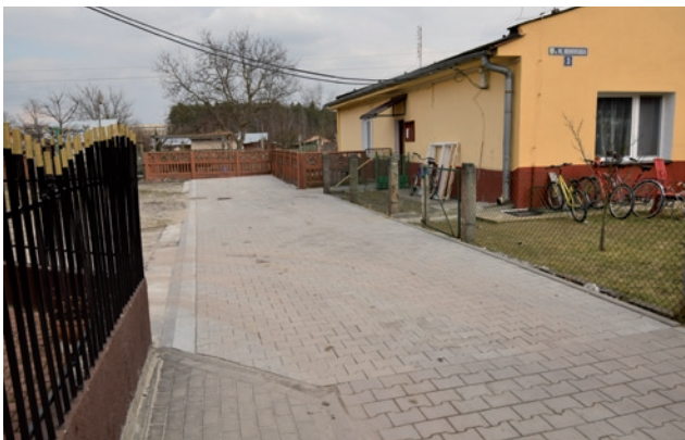
Chodnik przy ul. Broniewskiego 3