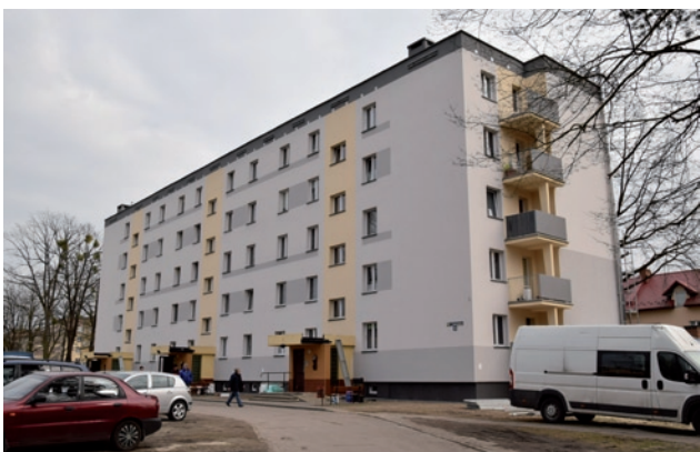
Nowy wizerunek budynku wspólnoty - ul. Krasickiego 35