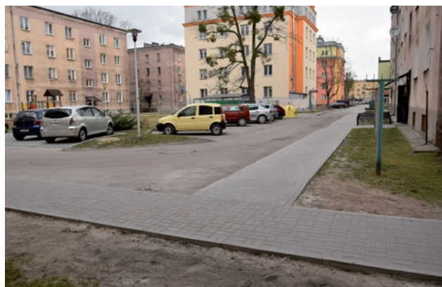
Nowy chodnik obok bloku przy ul. Jana Pawła II 3