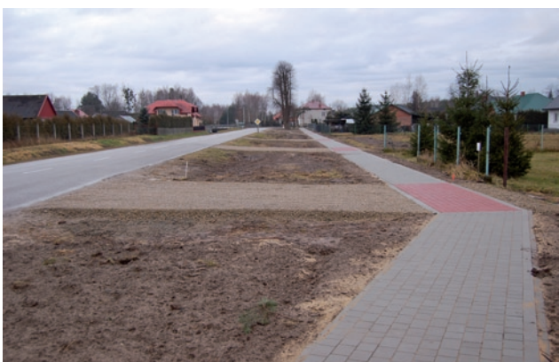
Chodnik w Alfredówce