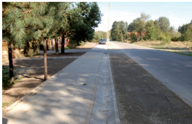
Chodnik przy ul. Hubala