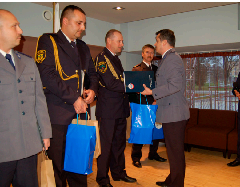
Podziękowanie dla Strażników Miejskich i Policjantów podczas ostatniej sesji VI kadencji