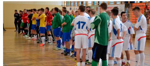
STAL CUP 2014