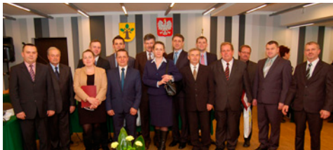
15 radnych VII kadencji