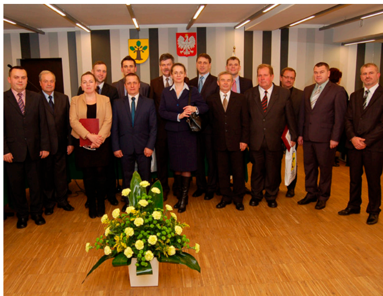
Radni Rady Miejskiej VII kadencji samorządu