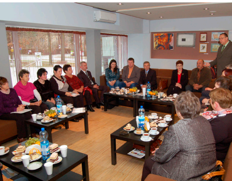
Podziękowania dla wolontariuszy