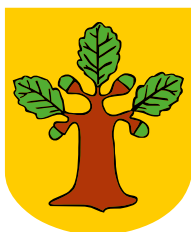
» str. 23