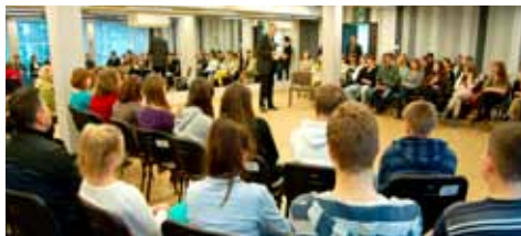
» str. 6 IV Nowodębskie Forum ...