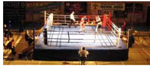
» str. 10 Wielkie boksowanie ...