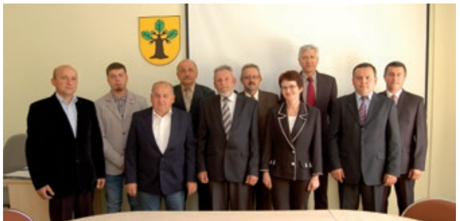
Burmistrz z sołtysami i przewodniczącymi kadencji 2015-2019